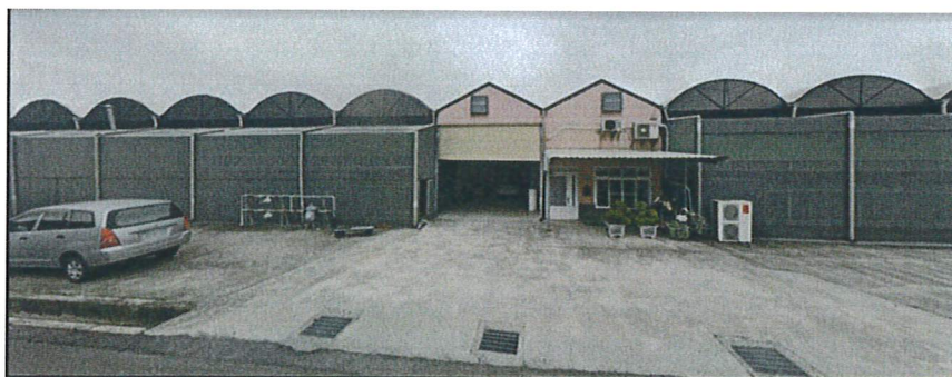
觀摩會地點：臺南市後壁區烏樹里烏樹林433號 車輛可路邊停靠